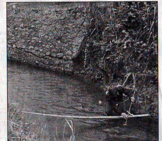
A kiképzésnek gyakorlati része is volt a szentmártoni telephelyen

Az elmúlt hétvégén a Körösök Vízügyi Igazgatóság hidrológiai találkozót szervezett Váradon azzal a céllal, hogy felkészítse a szakembereket az új dotációs eszközök használatára. Bemutatták nekik a szárnyas vízsebességmérő működését mely arra alkalmas, hogy meghatározza a víz sebességét és hozamát a természetes mederű, nem rendezett vízfolyásokon. A képzés két szakaszban zajlott: volt egy elméleti és egy gyakorlati rész, utóbbi a várad-szentmártoni telephelyen. Országosan 11 korszerű szárnyas vízsebességmérőt vásároltak, melyek segítik a hatóság hidrológiai tevékenységét.