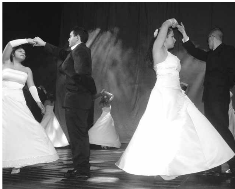
A nyitótánccal kezdődött a műsor