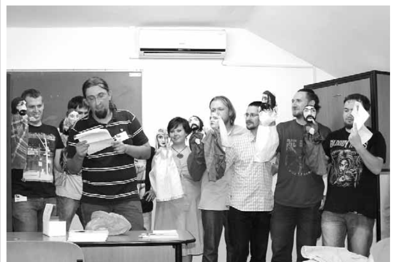
A bábjátéknak mindig nagy sikere szokott lenni